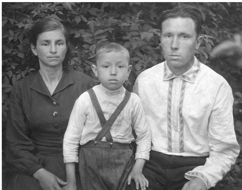
1945 год. Закончилась война

Например, неожиданно у меня заболели глаза — наверное, попала инфекция или грязь. Я стал слепнуть. Своих врачей-окулистов и до войны-то у нас не водилось, а что было делать теперь? Пришлось собрать по соседям кое-какие продукты, преодолеть страх и обратиться в город к немецкому врачу. Он тоже не был специалистом по глазным заболеваниям, но дал какие-то лекарства, лечение которыми сохранило мне зрение. Видимо, не все немцы были фашистами.