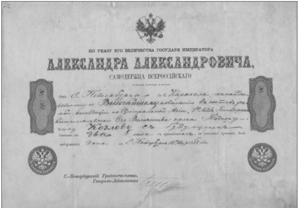
Подорожная П.К. Козлова от Санкт-Петербурга до Каракола, 1888. Архив РГО