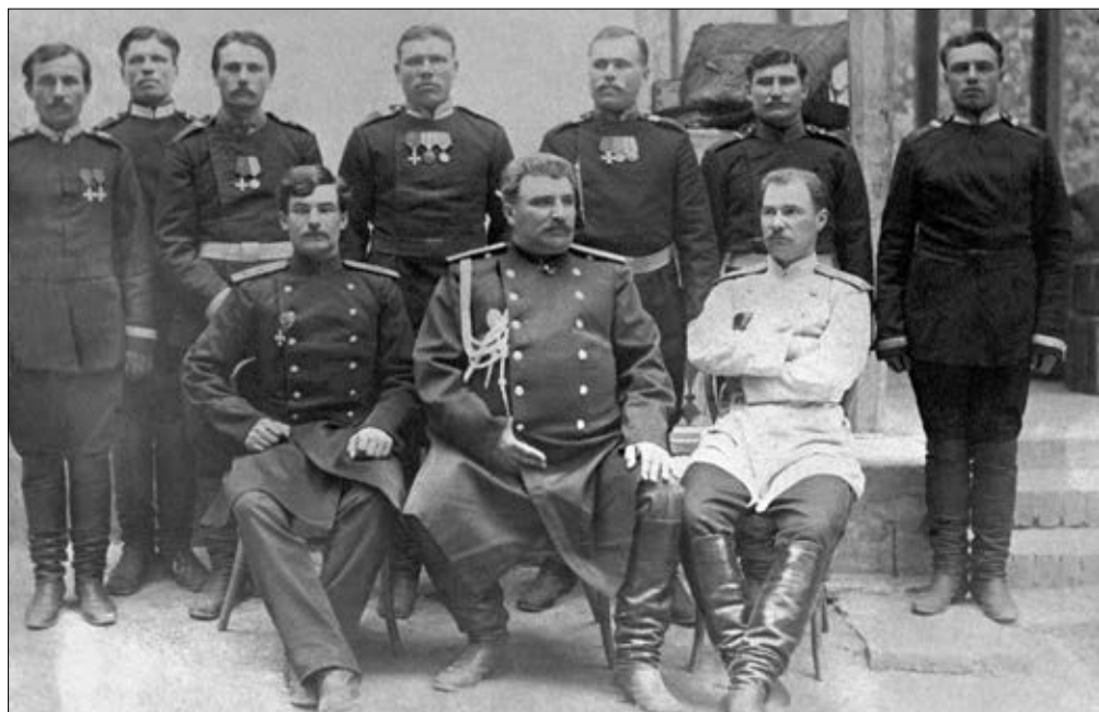
Участники 5-й Центральноазиатской экспедиции Н.М. Пржевальского, 1888. Сидят слева направо: П.К. Козлов, Н.М. Пржевальский, В.И. Роборовский.