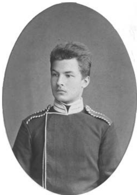
Петр Козлов, 1883