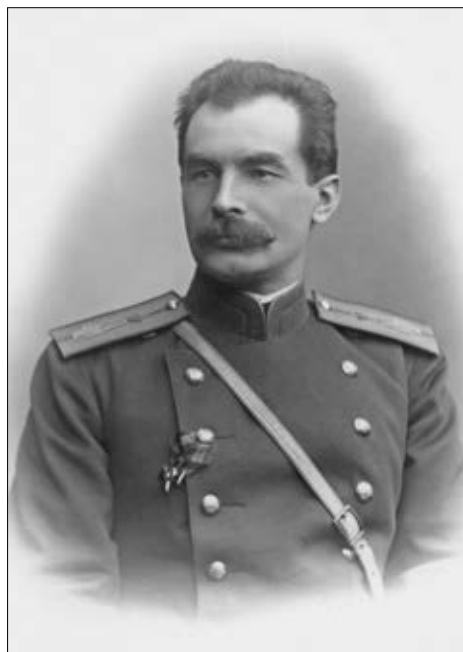
П.К. Козлов, 1907. Музей П.К. Козлова