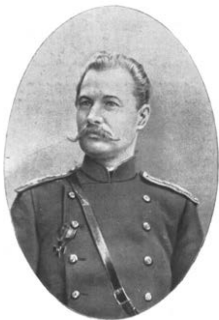
В.И. Роборовский (1856-1910).