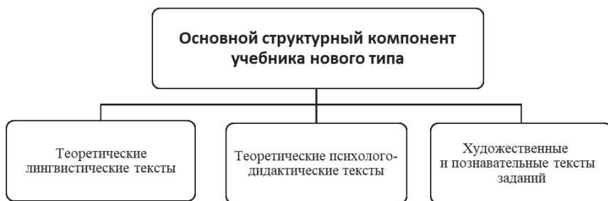
Рис. 2. Основной структурный компонент учебника нового типа

Функцией одного из них является знакомство школьников с учеными-лингвистами , внесшими значительный вклад в науку. Рассказ