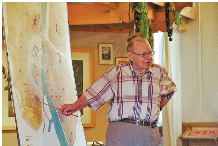
Лекция об археологии Новгорода студентам-практикантам. Новгород, 2006 г.