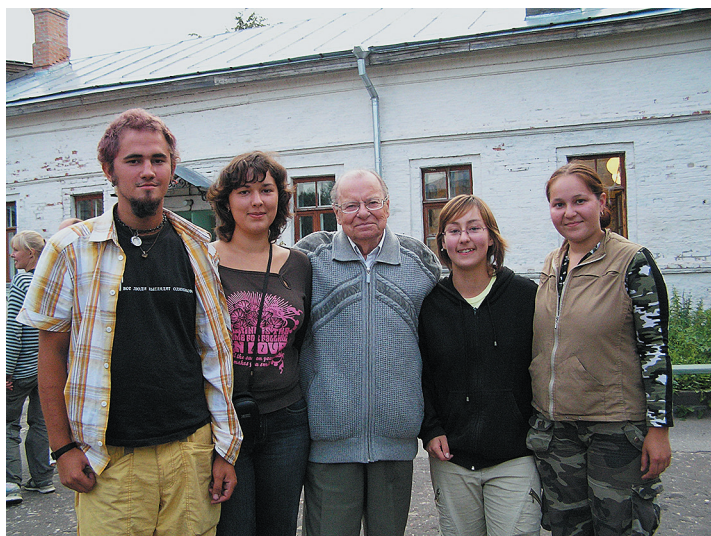
Со студентами кафедры археологии. Новгород, 26 июля 2007 г.