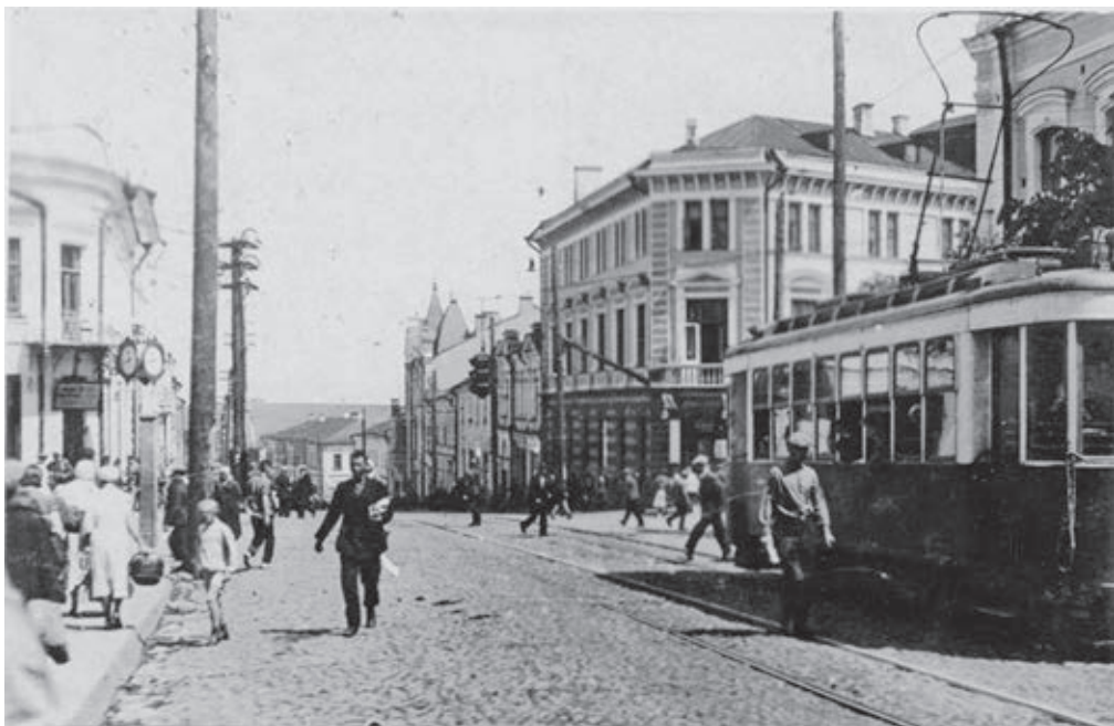
Перекресток улиц Большой Советской и Ленинской — место, которое в Смоленске называется «Под часами»