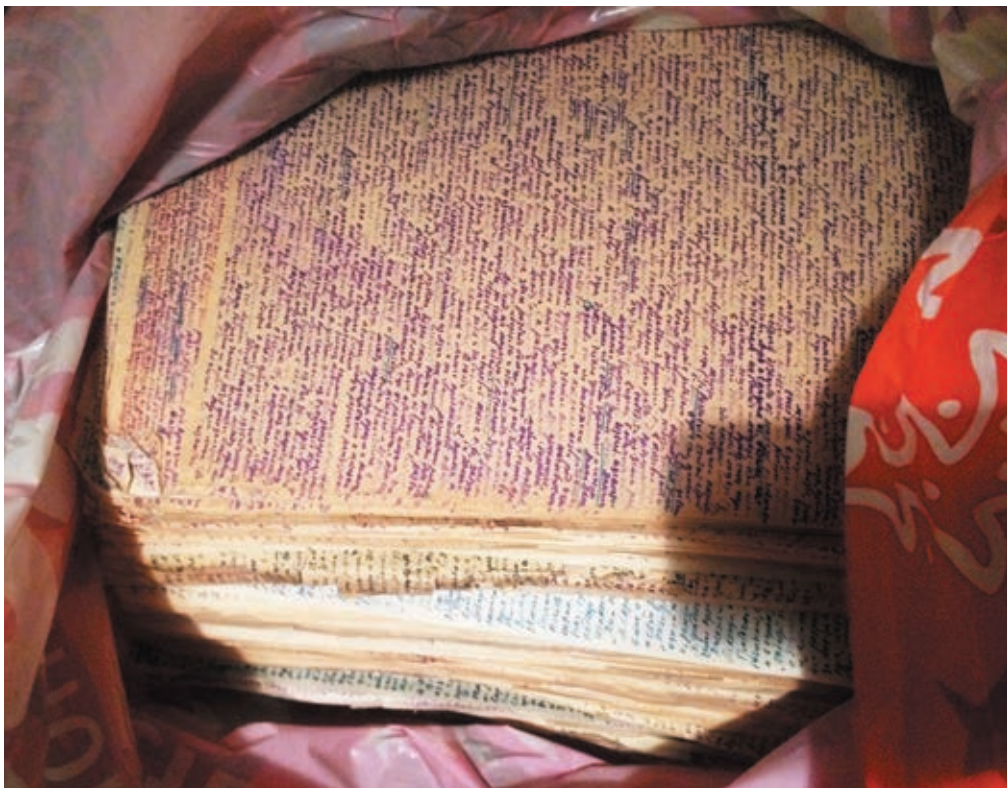
Стопка меньшеагинских конспектов