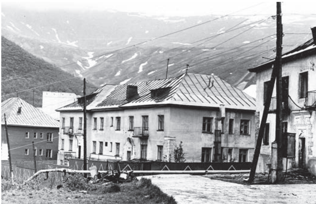
Инвалидный дом в Кировске